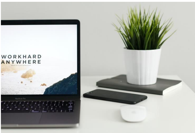
Imagen 06.

De la experiencia sugerida y vivida de 100% Homeworking en estos días, con aislamiento social instalado en nuestra sociedad, parecería que laboralmente nos deja la sensación de que “nos falta algo”, ya que no tenemos compañeros a los que mirar o con los que compartir gestos o impresiones. En muchos casos, se hace presente la necesidad de salir a una reunión o pararnos para conectarnos socialmente con otros. El homeworking logrará ser una solución y complemento para algunos casos pero, es muy difícil que sustituya el clima de las empresas. El desafío para las corporaciones es evolucionar sus espacios para que el trabajador se sienta pleno en su trabajo así como es su vida.