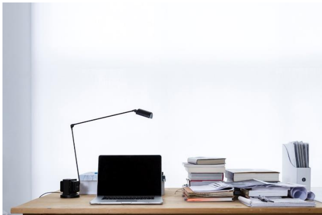
Imagen 02.

Los resultados de una encuesta reciente de Gartner 2 revelaron que el 74% de los gerentes esperan trasladar gran parte de los trabajadores fijos de la oficina a la forma de trabajo remoto permanente después de COVID-19.