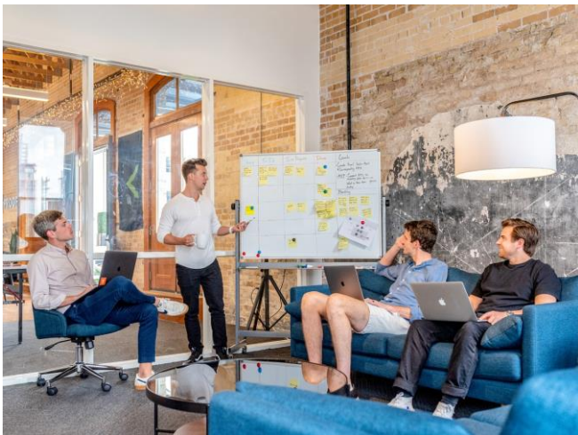
Imagen 04.

Espacios simples, diseñados de manera inteligente para las nuevas generaciones (Y,Z), logrando sentido de comunidad y de pertenencia. La salud y el bienestar de los empleados serán la principal preocupación corporativa.