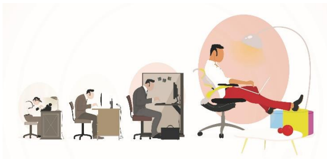
Imagen 1. Evolución de la oficina por Contract.

La oficina corporativa ha ido acompañando la forma en que ha evolucionado el trabajo. Es elocuente y sensata la representación.