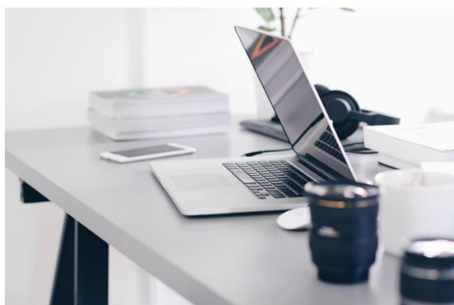
Imagen 03.

Hay otros especializados por género como The Riveter (perfilado para mujeres) y otros por rubro como tecnología, artes o para inmobiliarias.