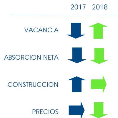
Gráfico 1: INDICADORES

*. Puede solicitar los "Informes de mercado" anteriores.